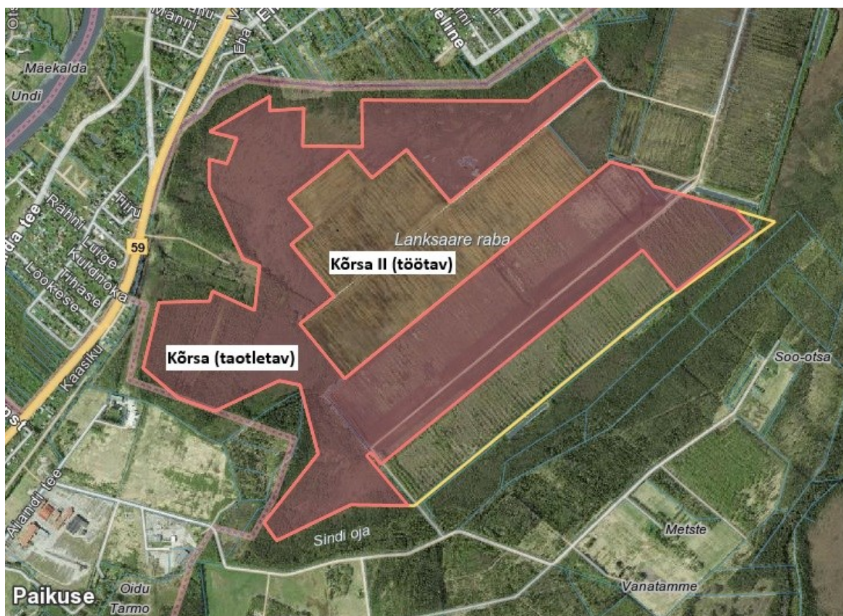
Joonis 1. Kõrsa taotletav turbatootmisala (keskel töötav Kõrsa II turbatootmisala).

KMH viidi läbi keskkonnaloa (tegevusloa) andmise üle otsuse tegemiseks, sh loatingimuste määramiseks. KMH käigus hinnati planeeritava tegevuse ja selle reaalsete alternatiivsete võimaluste otseseid ning kaudseid mõjusid keskkonnameetritele, piiriülesusele, inimese tervisele, heaolule ja varale, kultuuripärandile. KMH käigus töötati välja keskkonnameetmed olulise keskkonnamõju vältimiseks või vähendamiseks. Keskkonnamõju hindas KMH juhtekspert või eksperdirühm koos arendajaga.